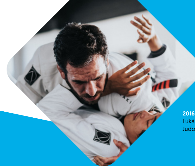
2016 Rio de Janeiro Lukáš Krpálek Judo – do 10 kg

Na trh je uveden první produkt ze společné laboratoře nadnárodního Asseco Solutions . Všechny stěžejní produkty jsou nově nabízeny na cloudové platformě nazvané ERPORT .