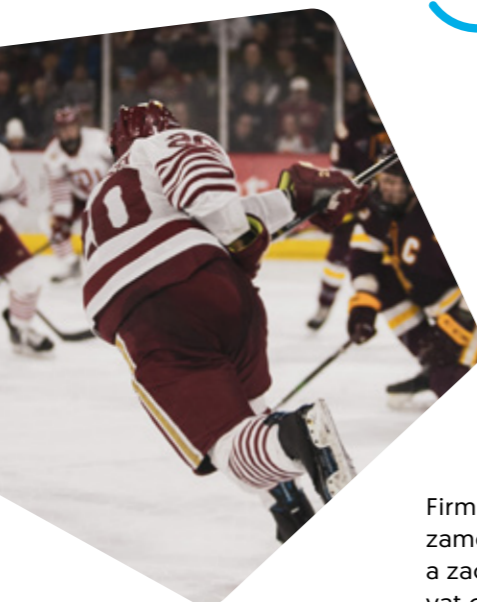
1989 Nagano Lední hokej

Začátek manažerského řízení společnosti zhruba o 60 zaměstnancích .